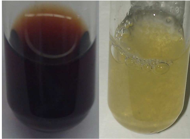
Abb. 7 - rotes Blutlaugensalz (links) mit Waschmittel-Lsg. (rechts).

Beobachtung: Nachdem Eisen(III)-chlorid-Lsg. und Kaliumthiocyanat-Lsg. zueinander gegeben wurden, färbt sich die Lösung rot. Nach Waschmittel-Lsg.-Zugabe entfärbt sich die Lösung.