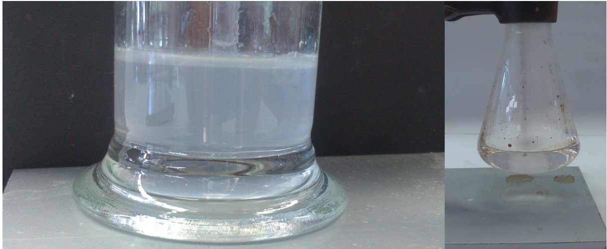
Abb. 5: Links: Trübung des Kalkwassers durch CO 2 , Rechts: Entfärbte Lösung nach der Glucose-Oxidation.

Abb. 4 - Versuchsaufbau der Glucose-Oxidation. Links: Erlenmeyerkolben mit Glucose, Kaliumpermanganat und Schwefelsäure, Rechts: Waschflasche mit Kalkwasser.