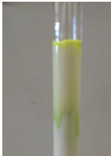
Abb. 2 Beginn der Trennung