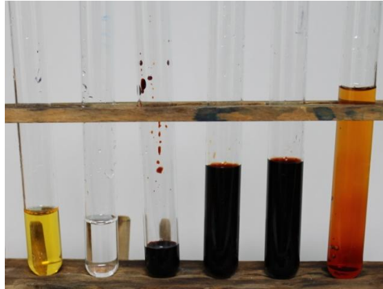
Abb. 1 Gelbe Eisennitratlösung, farblose Ammoniumthiocyanat und blutroter Eisenthiocyanat-Komplex als Vergleichslösungen, Eisenthiocyanat-Komplex mit weiterer Eisennitrat, Ammoniumthiocyanat-Lösung und mit Wasser (links nach rechts)

Deutung: Es besteht zwischen den Eisenhexaquakomplex sowie den Thiocyanatanionen auf der Eduktseite und dem blutroten Eisenthiocyanatkomplex ein Komplexeleichgewicht: