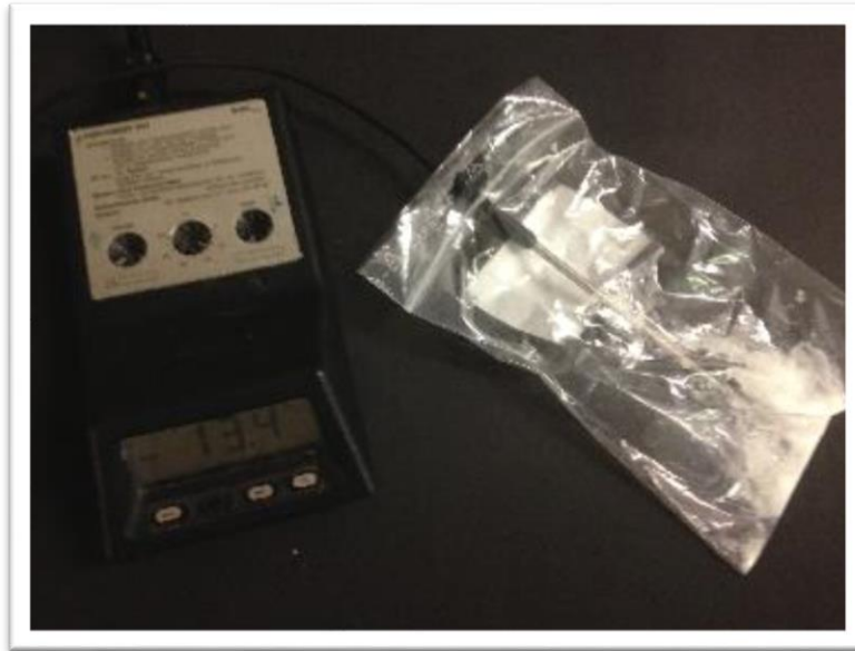
Abb. 1 - Temperaturmessung der Kältemischung.

Deutung: Gemäß folgender Reaktionsgleichung entsteht bei der Reaktion Ammoniak, was sowohl den Geruch als auch die Färbung des Indikatorpapiers erklärt, das einen pH-Wert von ca. 12 angezeigt hat.