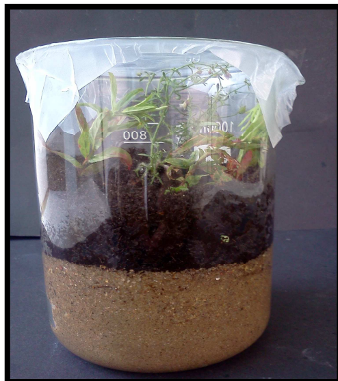
Abb. 6 – Versuchsaufbau „Wasserkreislauf“