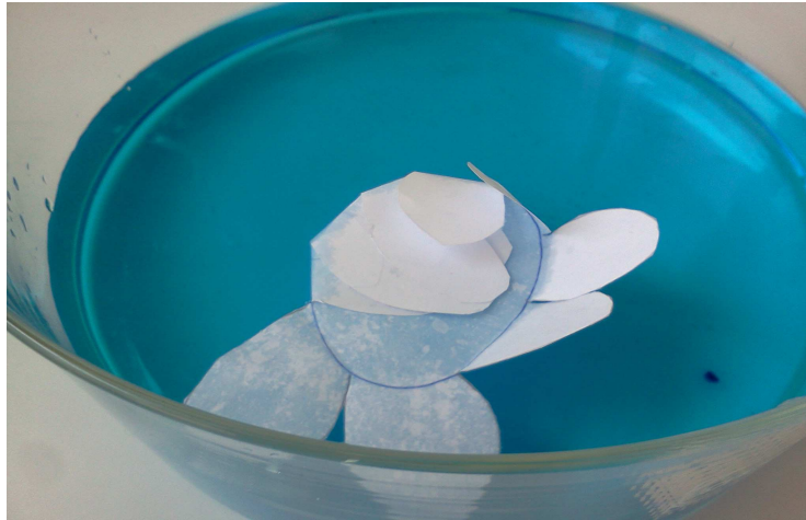
Abb. 11 - Die Rose öffnet sich und man sieht wo das Wasser im Papier aufsteigt und wo nicht

Deutung: Aufgrund der Adhäsionskraft von Wasser mit dem Glas steigt das Wasser in den Kapillaren nach oben und bildet eine Meniskusoberfläche. Das Öffnen der Seerose kann mit Hilfe dieses Phänomens verdeutlicht werden. Man nennt diese Eigenschaft Kapillarität. Ist die Adhäsion zwischen Wasser und Papier größer als die Kohäsion des Wassers steigt es in den Kapillaren des Papiers nach oben. Das Papier quillt auf und die Rose entfaltet ihre Blätter. Der gleiche Effekt ist auch in V 4 zu berücksichtigen, wo das Wasser im Boden nach oben steigt und an der Oberfläche verdunstet oder von den Wurzeln der Pflanzen aufgenommen werden kann.