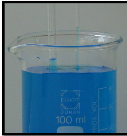
Abb. 9 – Versuchsaufbau 1 „Die Wasserrose“

Beobachtung 1: Das Wasser steigt in den Kapillare hoch. In der Kapillare mit dem geringeren Durchmesser steigt das Wasser höher als in dem mit dem größeren Durchmesser.