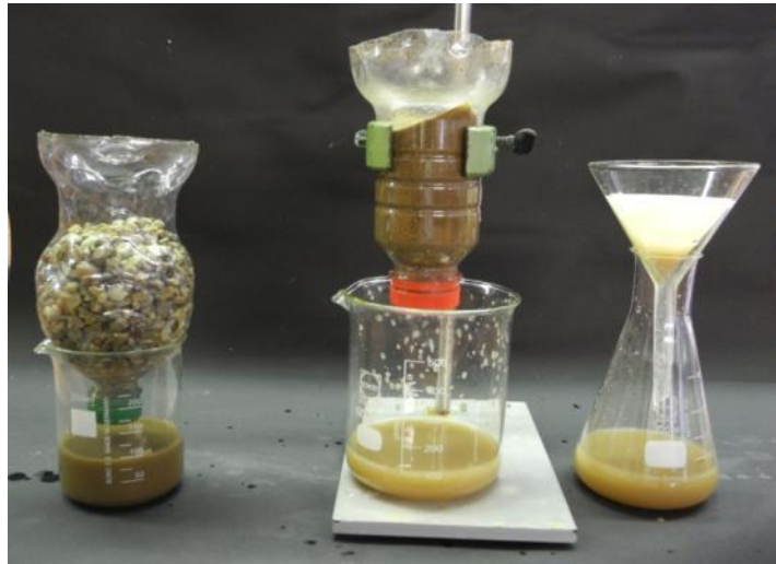
Abbildung 1: Versuchsaufbau Modellexperiment zur Kläranlage. Die verschiedenen Schritte von links nach rechts.

Die Dispersion wird mit zunehmender Filterung klarer und es sind deutliche Unterschiede zwischen den Filtraten des Kiesfilters, des Sandfilters und des Filtrats nach Aufschlämmung mit Aktivkohle zu beobachten. Nach der letzten Filtration ist die Lösung klar.