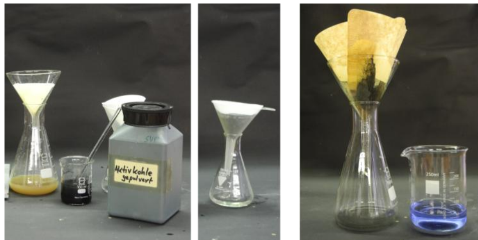
Abbildung 1: Aufschlammung des Filtrats aus Versuchsteil b mit Aktivkohle und Filtration (links, mitte). Vergleich des Filtrats der Tintenlösung zur ursprünglichen Lösung (rechts).

Beobachtung: Das Filtrat ist eine klare Lösung.