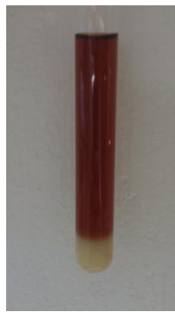
Abb. 3 - Dichteunterschied von Bananen- und Kirschsafft.

Beobachtung 1: Der Bananensaft vermischt sich nicht mit dem Kirschsafft. Zwischen den Säften bildet sich eine gut sichtbare Phasengrenze.