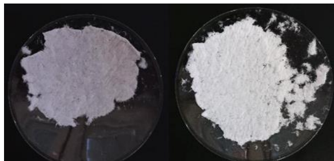
Abbildung 1: links: Ansatz 1 (ohne Waschmittel), rechts: Ansatz 2 (mit Waschmittel)