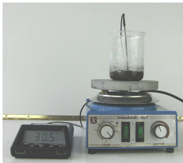
Abb. 4 - Versuchsaufbau der Reaktion von Kupferionen mit Eisen.

Durchführung: In 20 mL Wasser werden 0,5 g Kupfersulfat-pentahydrat gelöst und 10g Eisenpulver hinzugeben. Nun wird alle 10 Sekunden die Temperatur gemessen.