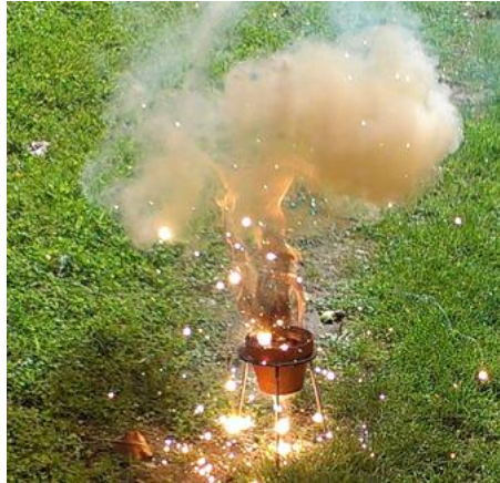
Abb. 2 - Reaktionsablauf