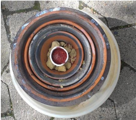
Abb. 1 - Aufbau der Apparatur