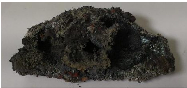
Abb. 3 - Eisenprodukt

Deutung: Eisenoxid und Aluminium → Roheisen und Aluminiumoxid