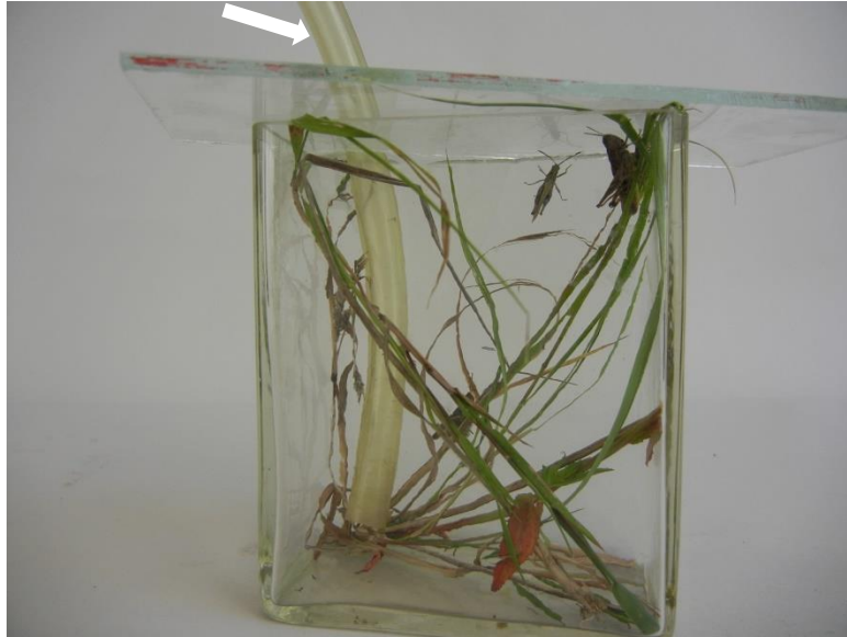
Abb. 1 Versuchsaufbau mit DC-Kammer. CO 2 -Gas wird durch den Schlauch eingeleitet (Pfeil). Die Heuschrecken befinden sich im oberen Teil des Terrariums.