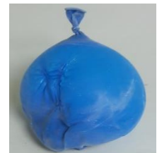
Abbildung 1 zeitlicher Verlauf der Beobachtung (von links nach rechts) der Luftballon bählt sich langsam wieder auf

Deutung: Luft enthält zu 21 % Sauerstoff und zu 78 % Stickstoff. Der Sauerstoff im Ballon kondensiert als erstes beim Abkühlen auf -183\text{ °C} , während der Stickstoff bei -196\text{ °C} flüssig wird. Man erhält im Ballon flüssige Luft, die beim Erwärmen wieder verdampft.