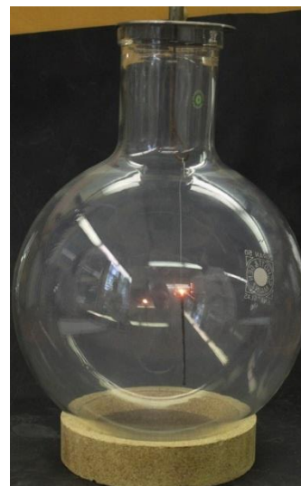
Abbildung 2 brennende Wunderkerze in der Stickstoffatmosphäre