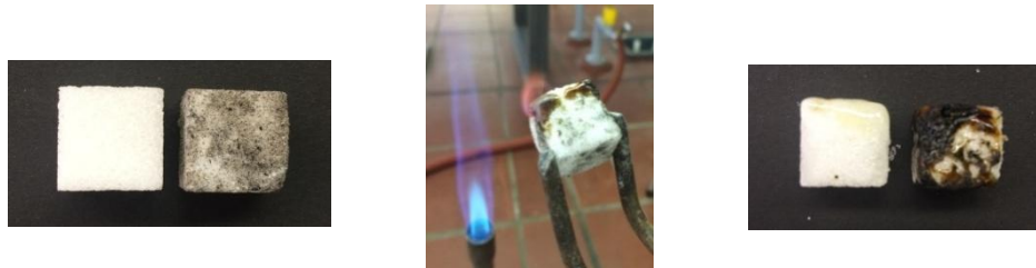
Abbildung 2: unpräparierter und mit Asche präparierter Zuckerwürfel vor dem Anzünden (links); präparierter, brennender Zuckerwürfel (mitte); unpräparierter und präparierter Zuckerwürfel nach dem Anzünden (rechts).