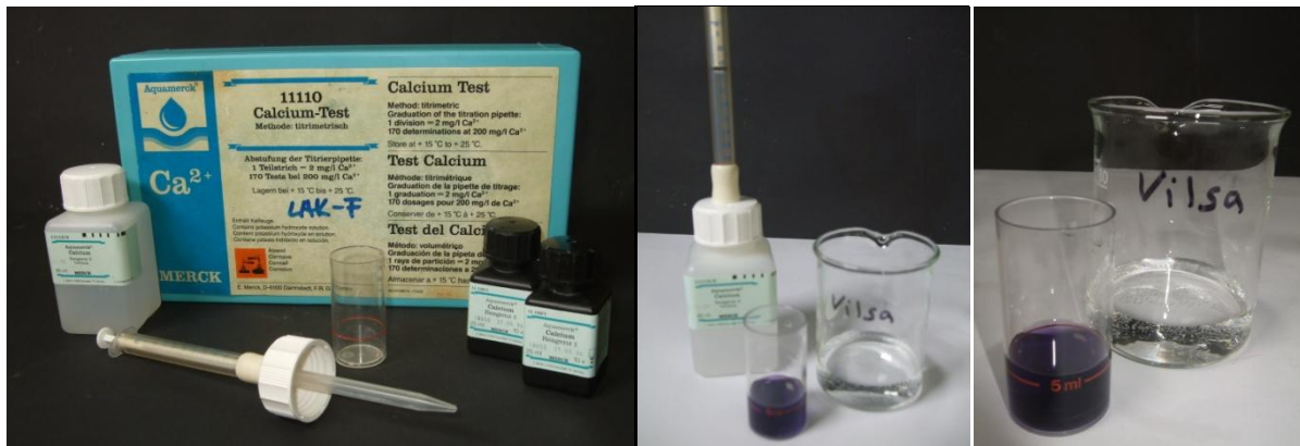
Abb. 4-6 – von links nach rechts: Calcium-Test Kasten, Probe Vilsa Naturelle mit Verbrauch Reagenz 3, Probe Vilsa Naturelle.

Deutung: Im destillierten Wasser sind keine Calciumionen vorhanden, im Regenwasser mehr Calciumionen und in Vilsa Naturelle und im Leitungswasser die meisten.