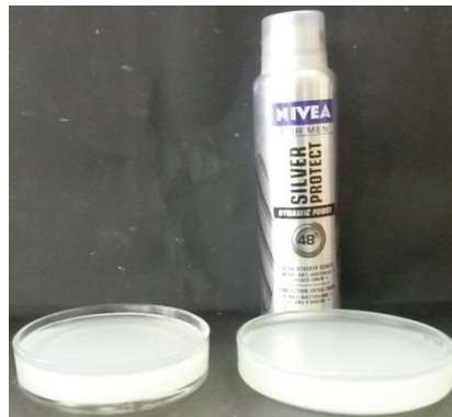
Abb. 1 - Agarplatten am ersten Tag.

Durchführung: 2 g Agar-Agar werden in 200 mL demineralisiertem Wasser aufgeköcht und in Petrischalen gegossen. Eine der Agarplatten wird mit Nivea-Silver-Protect Deo besprüht und mit Mikroorganismen in der Umgebung in Kontakt gebracht (hier Türgriffe). Die Platten werden drei Tage bei Raumtemperatur gelagert.