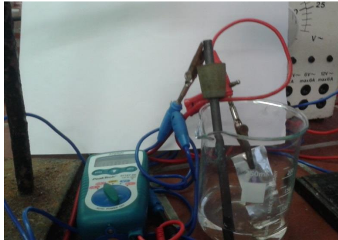
Abb.1: Eloxieren von Aluminium