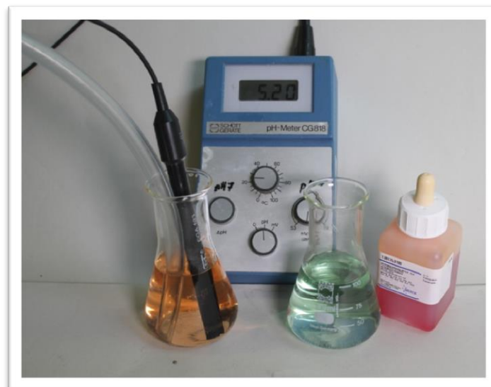
Abb. 2 - Links: Kohlenstoffdioxidgas wurde in Natriumchloridlösung eingeleitet. Der pH-Wert ist gesunken. Rechts: pH-neutrale Vergleichslösung.

Beobachtung: Beide Lösungen sind am Anfang grün. Bei Einleiten von Kohlenstoffgas färbt sich die Lösung gelb. Das pH-Meter zeigt nach wenigen Minuten konstant einen pH von 5.2 an.