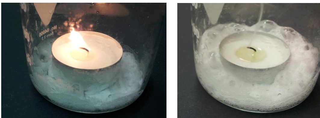
Abbildung 1 - Versuchsaufbau. Links: vor der Zugabe von Essigessenz. rechts: nach der Zugabe

Beobachtung: Es ist eine Gasentwicklung zu beobachten. Nach einigen Sekunden erlischt die Kerze.