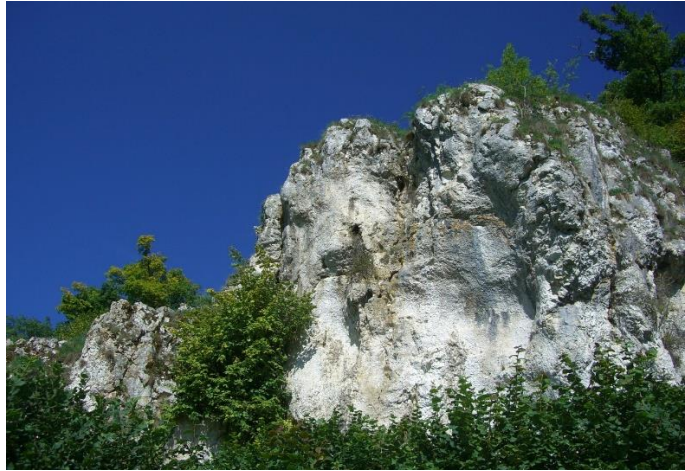
Kagberg (Kalkfelsen) bei Giengen in Bayern

Die Formelschreibweise von Calciumcarbonat lautet \text{CaCO}_3 . In großen Mengen findet man Kalkstein zum Beispiel in Deutschland, die Kalkfelsen auf der Insel Rügen und auch in Großbritannien, die Kalkküste bei Dover.